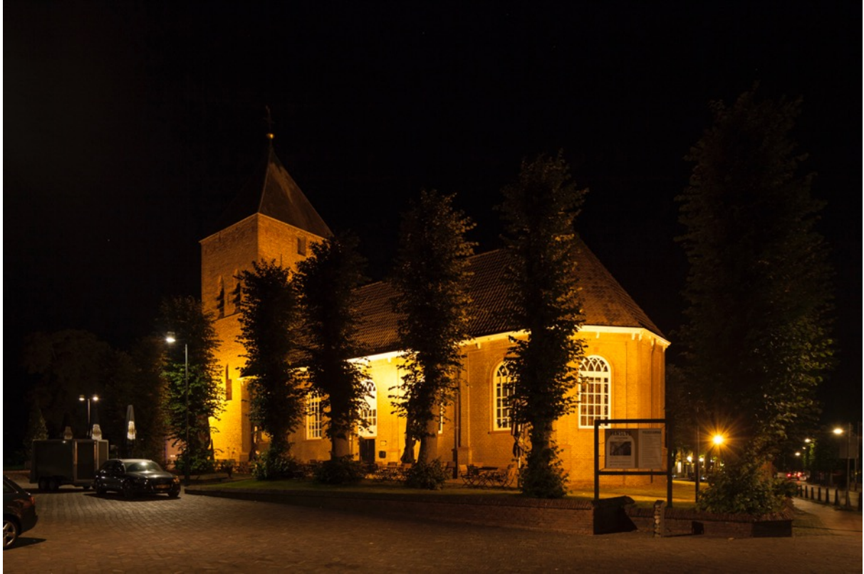
Foto: Kerk N374 in Borger; in de avond prima verlicht, in de nacht kan het uit.

De verlichting dient goed gericht te zijn en niet omhoog te stralen. Zo kan onnodige lichthinder en lichtvervuiling verminderd worden.