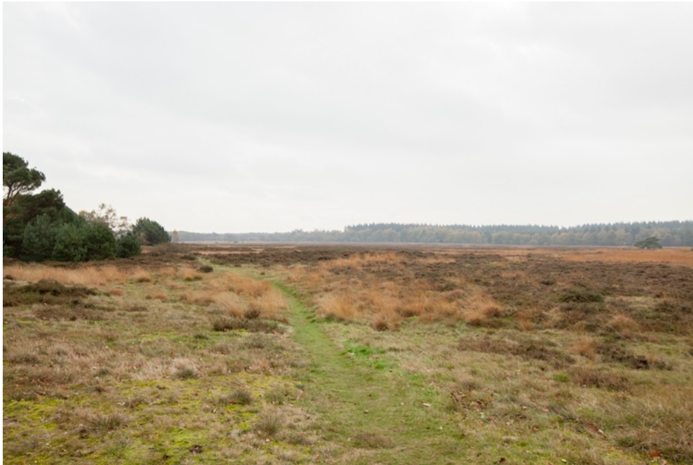
Foto: Heideveld in Exloo, natuurgebied met rijke flora en fauna dat we willen behouden en dus is er geen verlichting.

De bescherming van de duisternis en het donkere landschap valt onder de Wet Milieubeheer/Activiteitenbesluit. Het beschermen van de duisternis en het donkere landschap valt onder de zorgplicht. Het bevoegd gezag kan vanuit haar zorgplicht maatregelen of voorzieningen voorschrijven aan inrichtingen zoals gedefinieerd in artikel 1.1 lid 1 van de Wet milieubeheer.