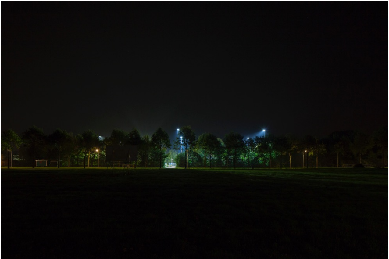
Foto: Sportveld Nieuw-Buinen. Het licht is van verre zichtbaar in het open landschap.

In de gemeente hebben we diverse sportparken. Deze liggen vaak in een open landschap of juist midden in de bossen. Ze zijn in de avonduren van grote afstand al zichtbaar door de enorme hoeveelheid licht.