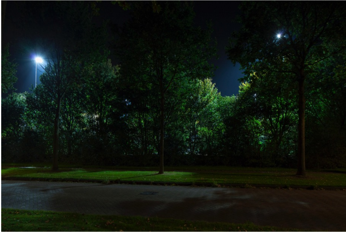
Foto: Zonnedauw in Nieuw-Buinen. Het licht van het sportveld schijnt ook op de weg waardoor het verkeer in verwarring gebracht kan worden of een weggebruiker verblind kan worden.