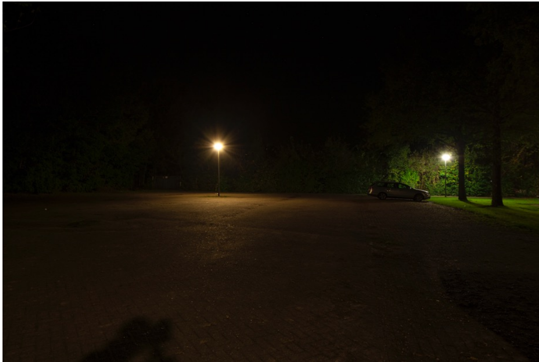
Foto: Noorderstraat in Buinerveen bij het sportveld. Verlichting op parkeerplaats. Dit is tijdens het sporten wenselijk, maar na de sluiting, als het terrein leeg is, kan het licht uit.

Het licht dat op de parkeerterreinen bij de sportvelden staat, is soms van de gemeente en soms van de verenigingen. Aangezien het licht op de sportvelden om 23.00 uur uit moet zijn, brandt daar dan geen licht meer. Maar op de parkeerterreinen is het licht meestal de hele nacht nog aan, terwijl er geen auto meer staat.