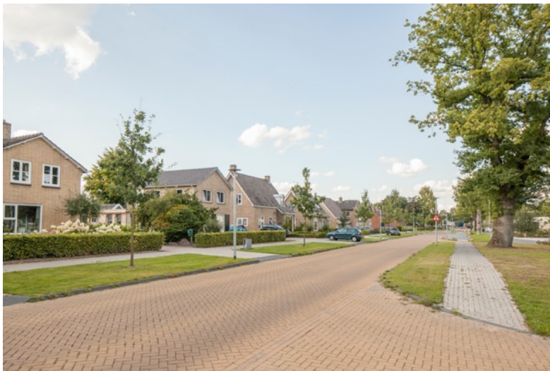
Foto: Molenstraat in Borger, nieuwe verlichting in de hele straat.

Al deze 25 kernen vormen samen de gemeente Borger-Odoorn. In totaal heeft de gemeente 7.000 lantaarnpalen. De verschillen in openbare verlichting zijn groot. Dat komt ook door het moment van aanleg.